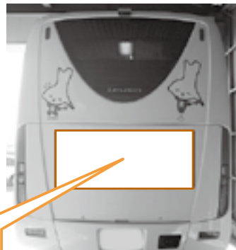
▲市バス背面(イメージ)