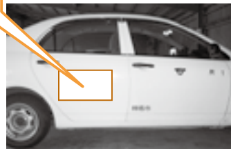
▲公用車側面(イメージ)